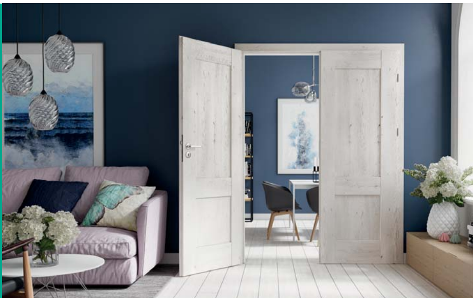
PORTA VERTE PRÉMIUM C.0, Skandináv Tölgy, SIMPLE ezüst kilincs