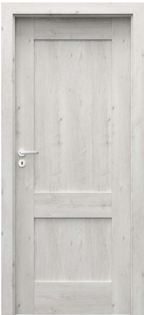
PORTA VERTE PRÉMIUM C.0, Skandináv Tölgy, SIMPLE ezüst kilincs