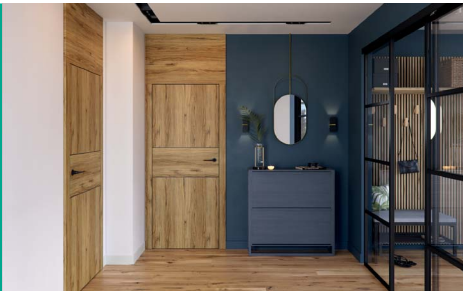
PORTA LEVEL C.2, Tölgy Catania. A hozzá készült tokkal, 100 mm-es felső panellel, AZALIA fekete kilincs