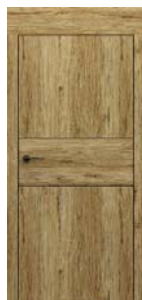
modell C.2 dekoratív berakással Tok 20 cm-es felső panellel