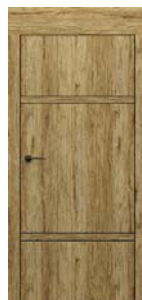
modell C.3 dekoratív berakással Tok 20 cm-es felső panellel