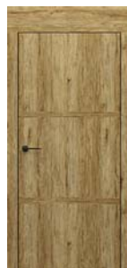
modell C.1 Tok 20 cm-es felső panellel