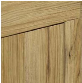
egyedi LEVEL tok

Az egyedi LEVEL tokot ajánljuk a Level ajtó lapokhoz. A felső panel elérhető kétféle irányú erezzel - vízszintes vagy függőleges - mely 6 választott felületre vonatkozik.