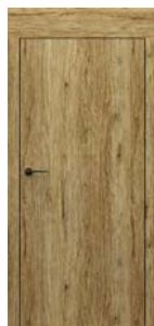
PORTA Dekor modell P Ísd 88 old.