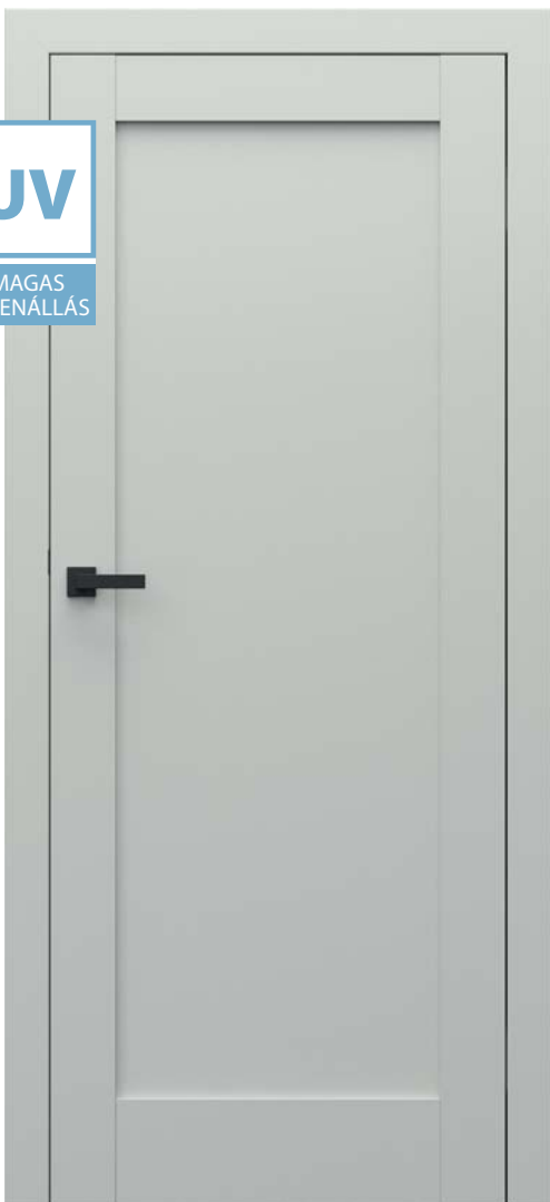
PORTA GRANDE A.0, Szürke, RUMBA fekete kilincs