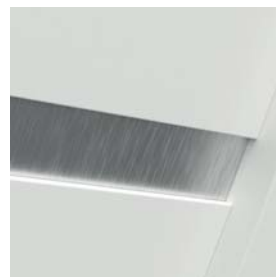
G0 modell - dekoratív lemez (szálcsiszolt alumínium) az ajtólap felületéhez viszonyítva süllyesztve. Független ereszettel opcionális - felár ellenében.