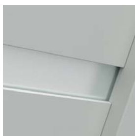
a G.4 modell üvegezése, az ajtólap felületéhez képest süllyesztett