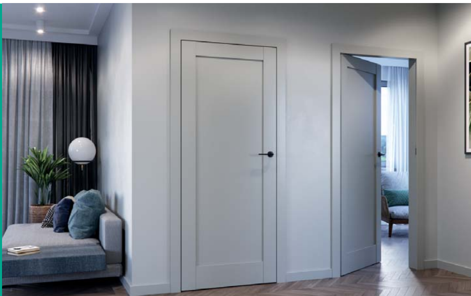
PORTA GRANDE A.0, Szürke, PORTA SYSTEM tok fordított falccal, takaróléccel, AZALIA fekete kilincs