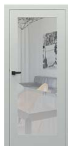
modell A.1 tükörrel