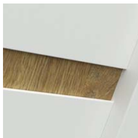
G0 modell - Dekoratív lemez (Portaperfect fólia vagy Természetes Tölgy furnér), az ajtólap felületéhez viszonyítva süllyesztve. Független erezettel opcionális - felár ellenében.