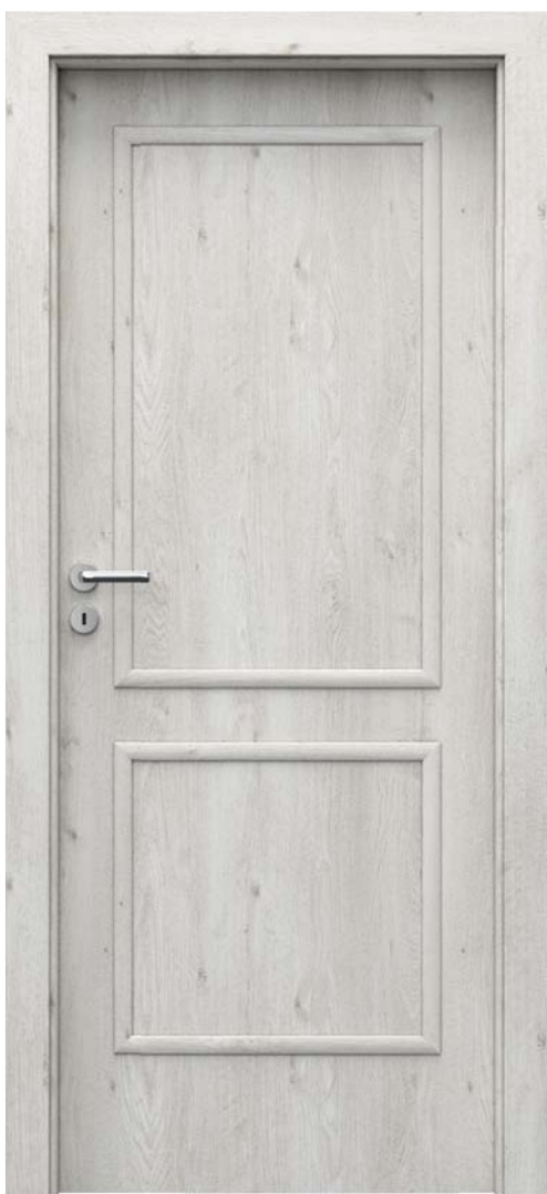
PORTA GRANDDECO 3.1, Norvég Fenyő