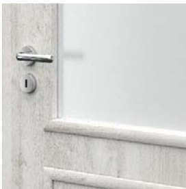
matt üveg PORTA GRANDDECO 3.2