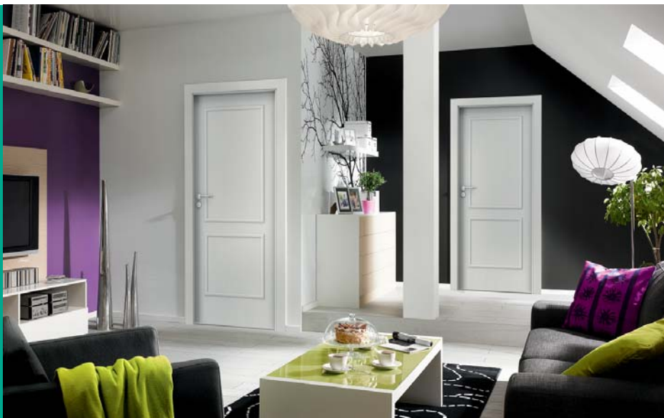
PORTA GRANDDECO 3.1, Norvég Fenyő