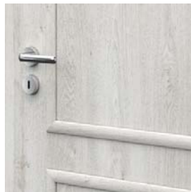
dekoratív keret PORTA GRANDDECO 3.1