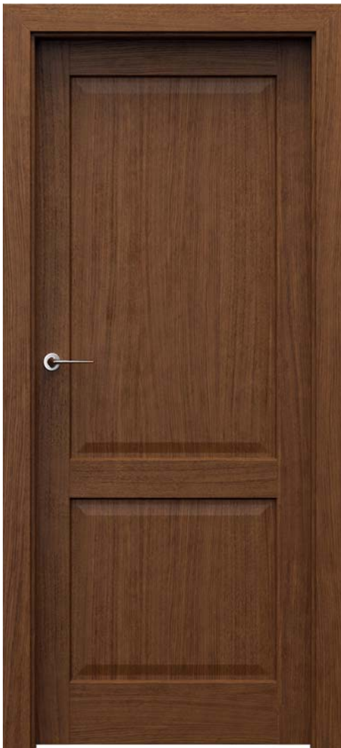
CORDOBA tele, Tabacco