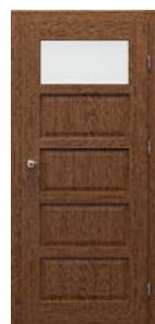
TOLEDO modell 1