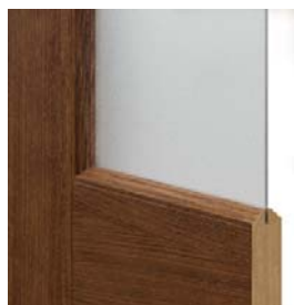
MADRID dekoratív profilú keret