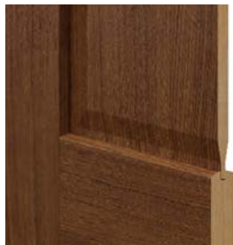
TOLEDO 20°-os keret profil panellel