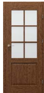
CORDOBA 2/3 üveges