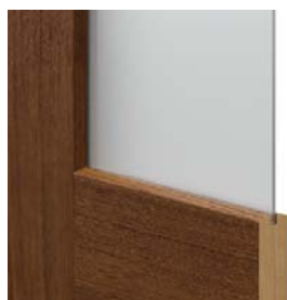
CORDOBA 20°-os keret profil