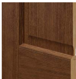
MADRID egyszerű panel profil