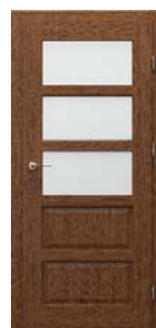
TOLEDO modell 4