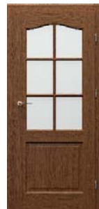
MADRID 2/3 üveges