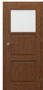
CORDOBA 1/3 üveges