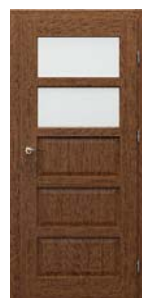
TOLEDO modell 2