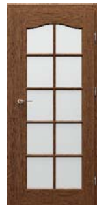
MADRID 3/3 üveges