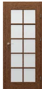
CORDOBA 3/3 üveges