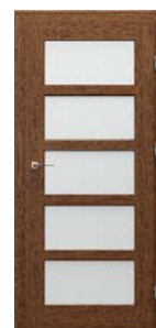
TOLEDO modell 5