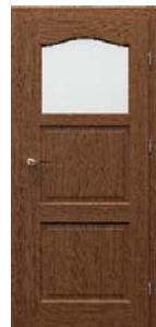
MADRID 1/3 üveges