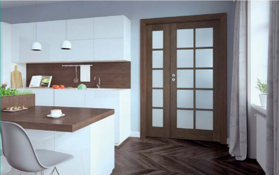
CORDOBA nagy üveges, K pannel, Tabacco, MODERN ezüst kilincs