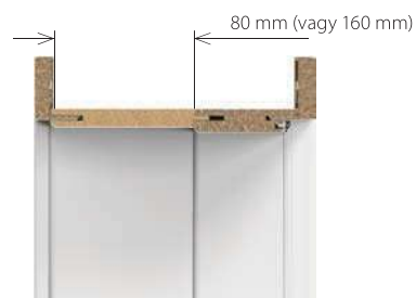
toktoldóval (80, 160 mm)