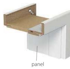
Porta SYSTEM + Toktoldó*