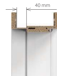
maximum ajtótök szélesebb tollal lehetőség feléért