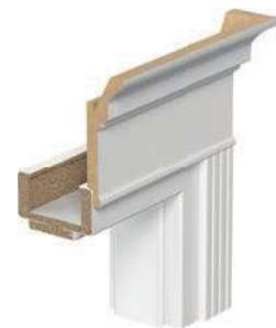
Porta SYSTEM + RETRO modul